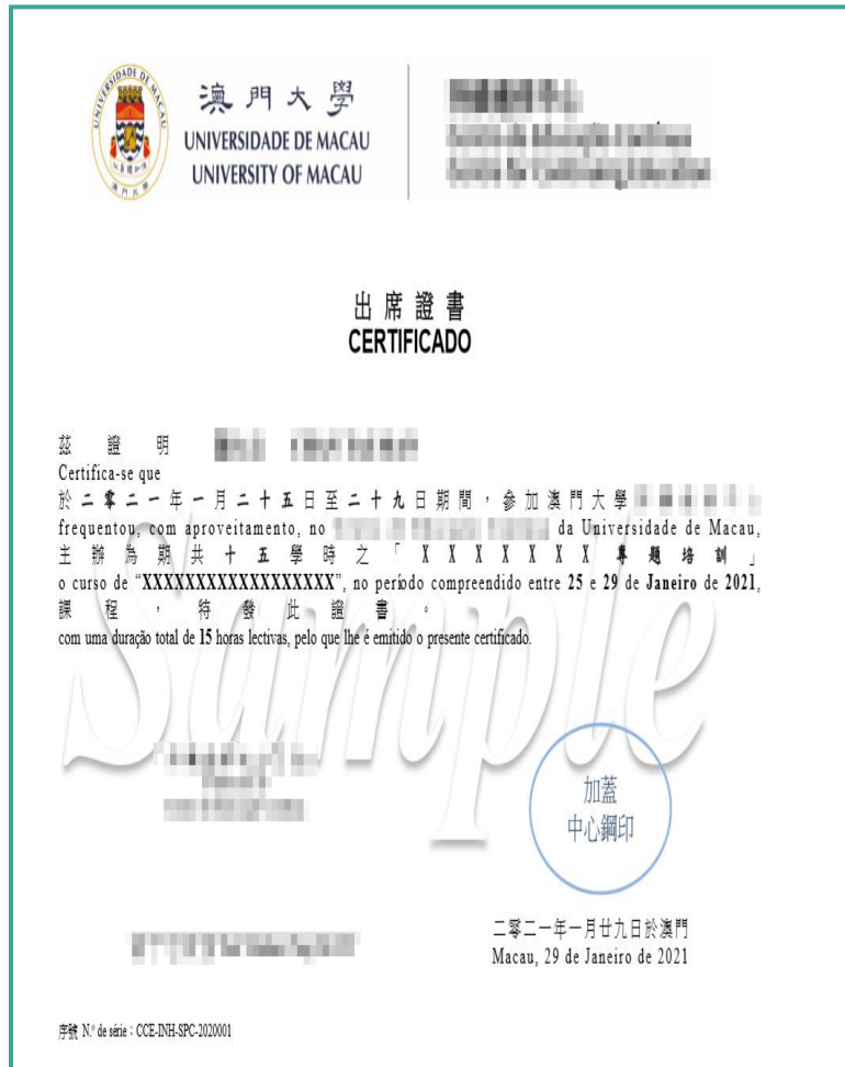
澳门大学官方证书

按时完成全部课程的学员， 无出现缺勤、漏交作业、 考核及格的情况，即可获得 澳门大学官方课程证书。